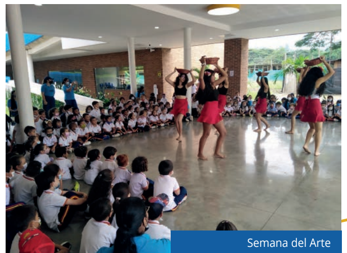
Semana del Arte