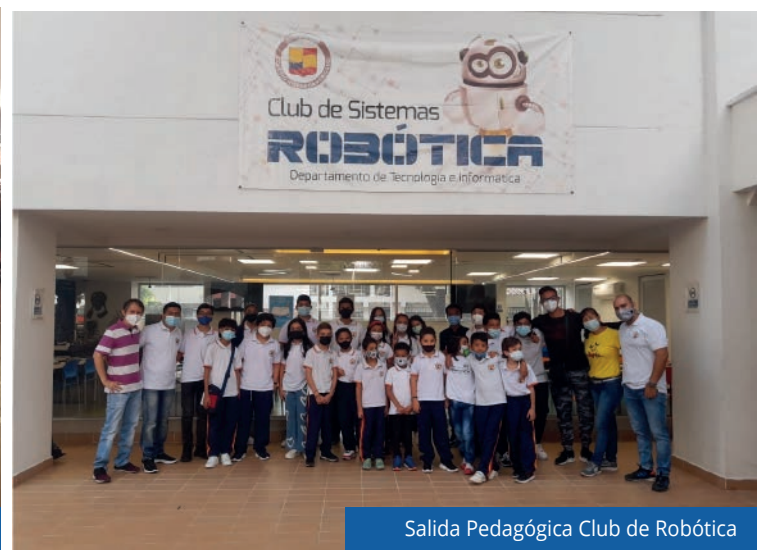
Salida Pedagógica Club de Robótica