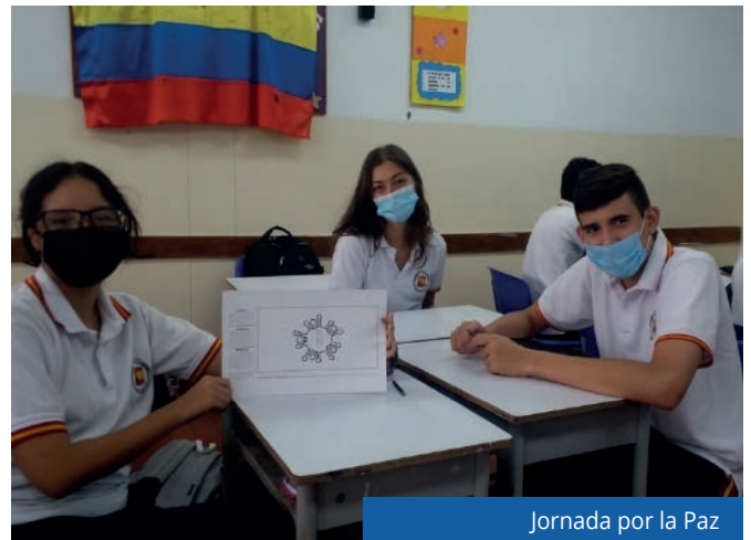
Jornada por la Paz