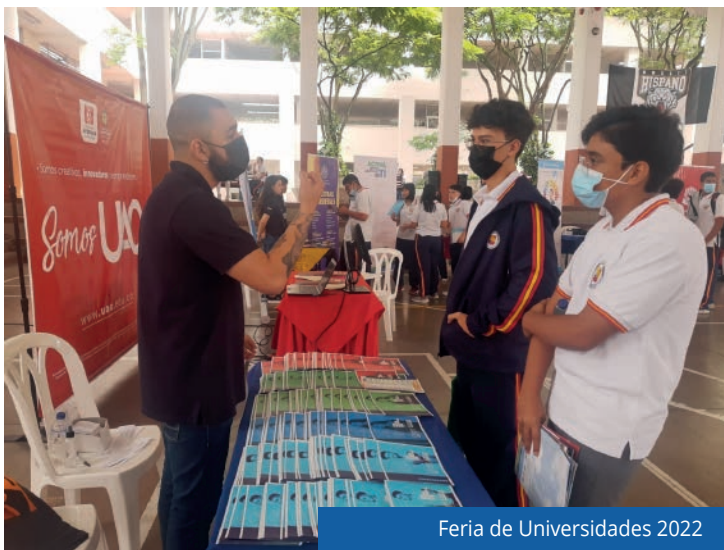
Feria de Universidades 2022